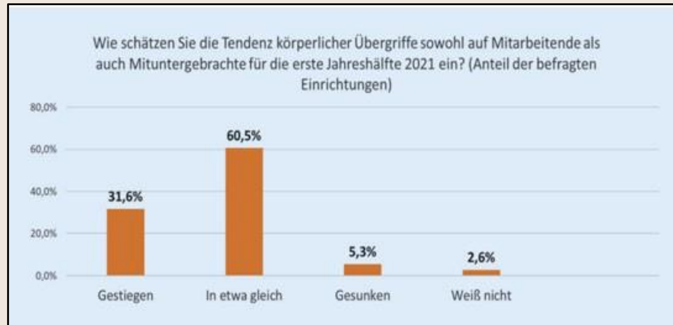
Abbildung 4: Tendenz von Übergriffen 2021 (Zeidler et al., 2023, S. 3)