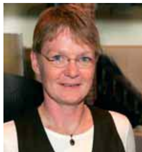
Ansprechpartnerin ➔ Prof. Dr. Anke Fesenfeld

Angesichts der demographischen Entwicklungen (Umkehrung der Alterspyramide; Fortschritte in der Medizin) geht der Blick in der Gesundheitswirtschaft immer mehr dahin, gangbare Lösungen für eine gute und qualitativ hochwertige Versorgung älterer und pflegebedürftiger Menschen zu finden. Forschungsaktivitäten der FHdD befassen sich in diesem Zusammenhang mit Fragestellungen zu Konzeptentwicklungen (pflegerisch und multidisziplinär), Schnittstellenproblematiken und Qualifizierungsmaßnahmen.