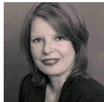
Vermittlung über: ➔ Prof. Dr. Andrea Schmidt

Eine sich ändernde Gesellschaft mit zunehmender Dienstleistungsorientierung, mit sozial- und umweltbewussten Kundinnen und Kunden auf der einen sowie eingeschränkten finanziellen und politischen Spielräumen auf der anderen Seite verlangt von Unternehmen ein größeres soziales Engagement. Das Zusammenspiel von Nonprofit-Organisationen und ökonomisch ausgerichteten Unternehmen gewinnt dabei an Bedeutung. Die FHdD widmet sich in diesem Zusammenhang der Frage, wie eine Balance zwischen jenen beiden Polen hergestellt werden kann und welche Projekte in diesem Kontext nachhaltig und fundiert initiiert werden können. Wir beraten Sie dahingehend, welche Projekte und Unternehmen ganz konkret für Ihre Trägersituation in Frage kommen. Dabei kooperieren wir mit ausgewiesenen Fachleuten, die auf eine langjährige Erfahrung in diesem Bereich verweisen können.